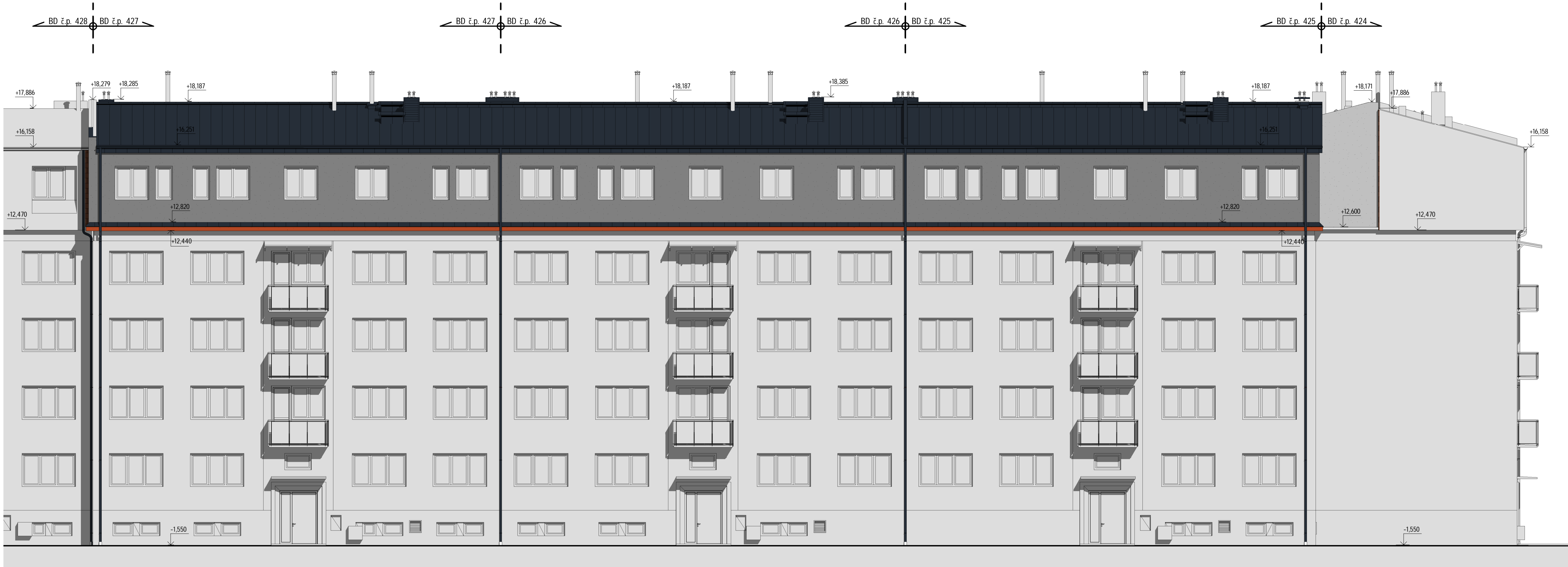
1 N_Pohled přední 1 : 100