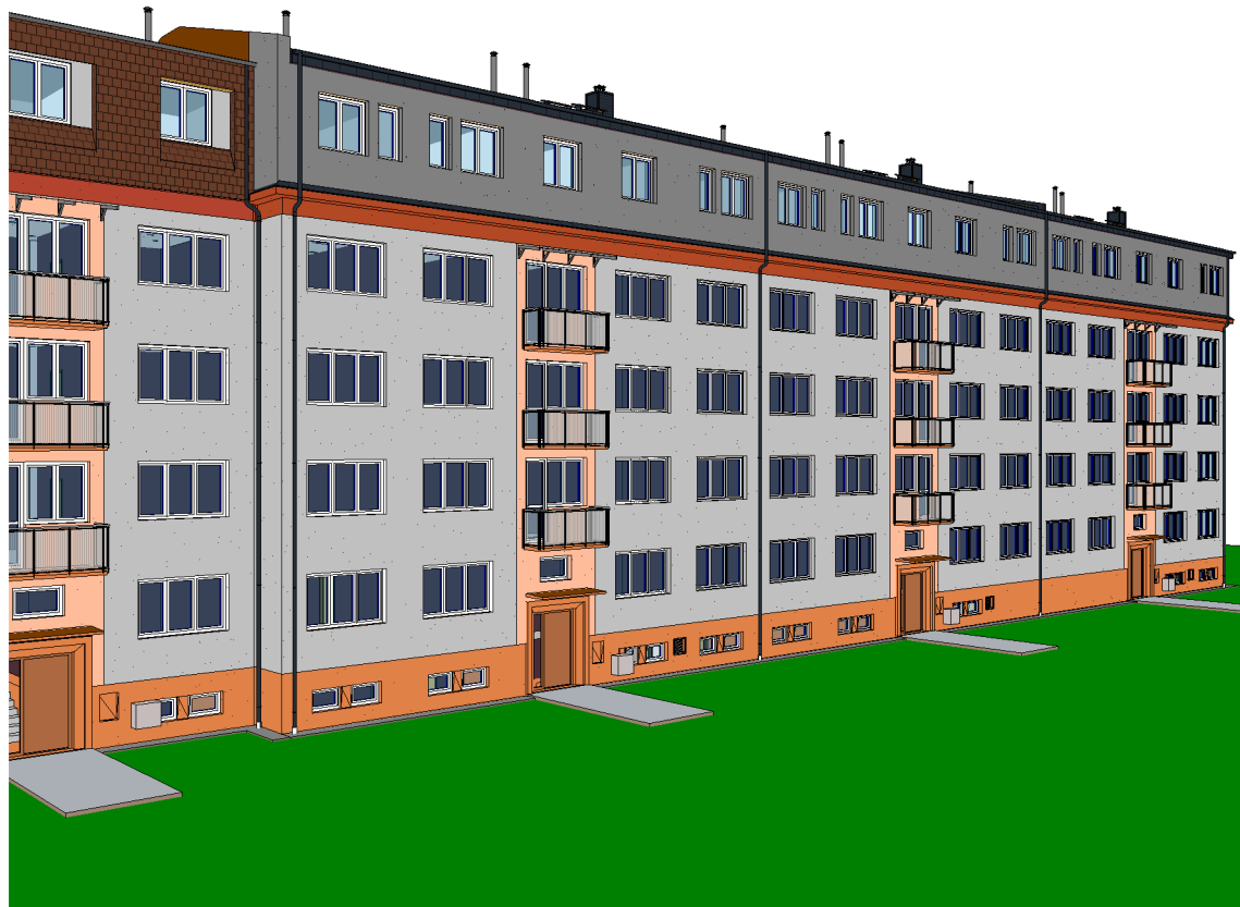
4 N_3D pohled 3_SS